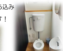
病児保育室の隣に子ども用トイレがあります。