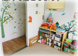
お子さまの年齢に合わせた玩具を用意します。