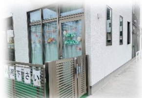
入口はつだ歯科駐車場側の門を入ってすぐ。

『はいしゃさんの保育園の病児保育室って、どんなところ?』 『1日どんな過ごし方をしているの?』 そんな疑問を安心に変えるべく、記念すべき第1号は、当園 病児保育室について紹介いたします✿